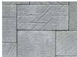
fumo di londra