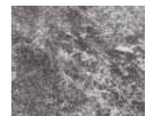
altre tipologie di prodotto